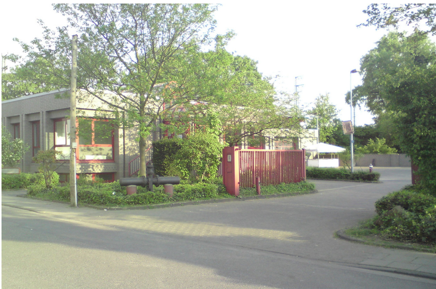
Das Zentrum der Kulturellen Begegnungen in der Mündelstraße ist für den theoretischen und den ersten praktischen Unterricht bestens geeignet.